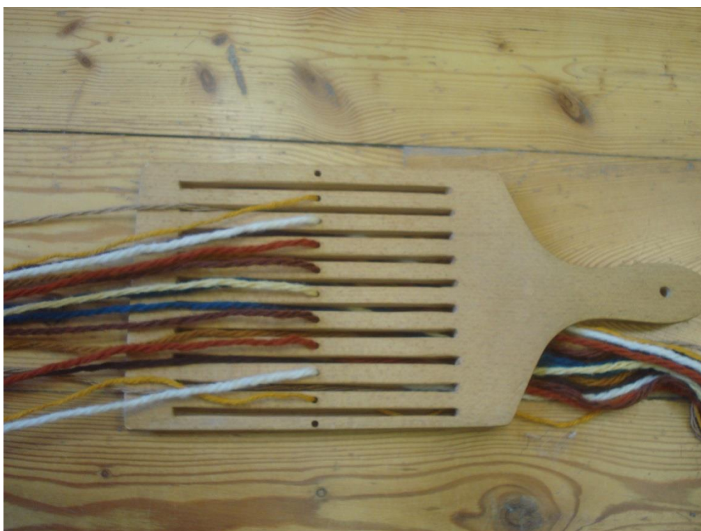
Befűzött láncfonalak a madzagszövő táblácskával.