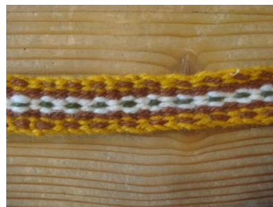
Befűzött kifeszített láncfonalak a madzagszövő táblácskával. Szövött szalag