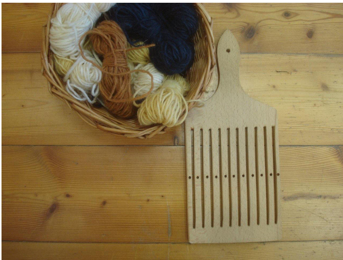
Madzagszövő tábla és fonalak